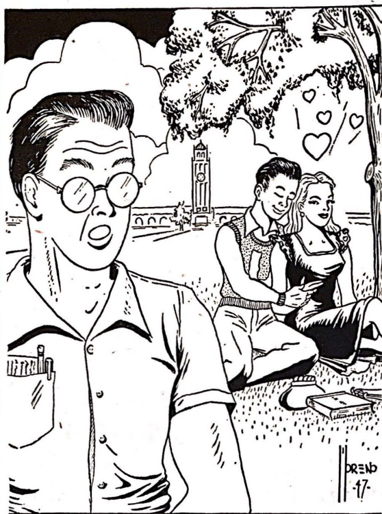
—¡Qué distinto sería si le aplicaran el detector de mentiras!