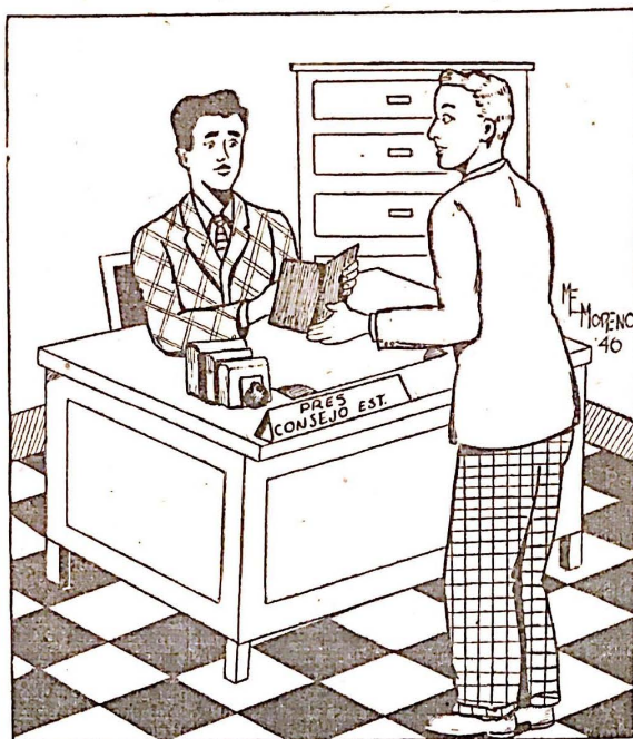
—Ojalá que se enmiende el reglamento pues pienso impulsar la candidatura del Soldado Desconocido...