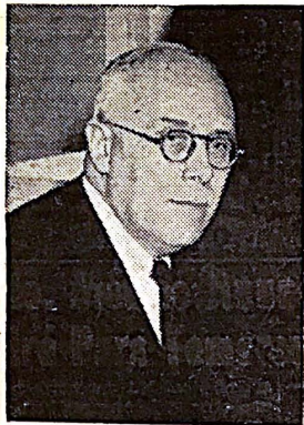
Don Tomás Navarro Tomás

Dos palabras recogen en síntesis apretada, las impresiones más honradas de nuestro viaje de estudios a