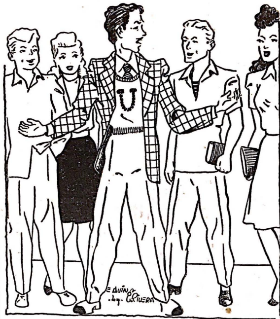
—HOMBRES de la Universidad, la hora de la venganza ha sonado: ¡Llegó María Antonieta Pons!