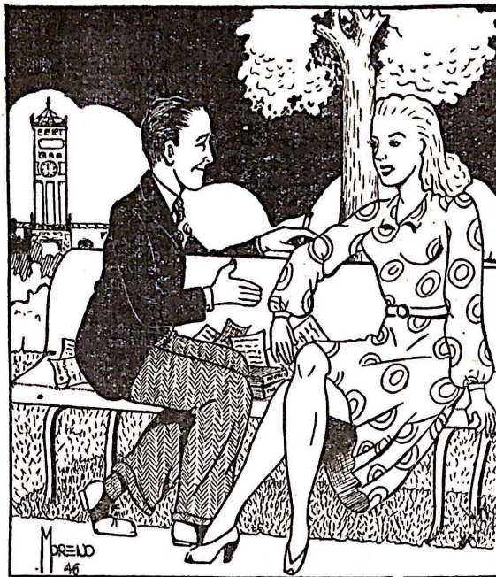
Te juro que si te haces una "pollina" rompemos las relaciones