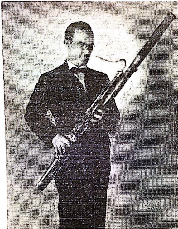
El gran fagotista puertorriqueño, Angel del Busto, cuyo reciente concierto en el Teatro de la Universidad ha sido comentado elogiosamente. El señor del Busto es el único solista de fagot conocido en el mundo.