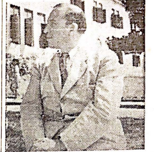
Don Pedro Salinas