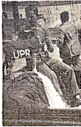
La cabrita, mascota tradicional de los rojos y blancos, figura importante en los festivales de Pista y Campo, aparecerá este año otra vez.