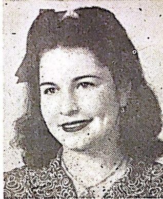
Eneida Bordallo Colegio Artes y Ciencias