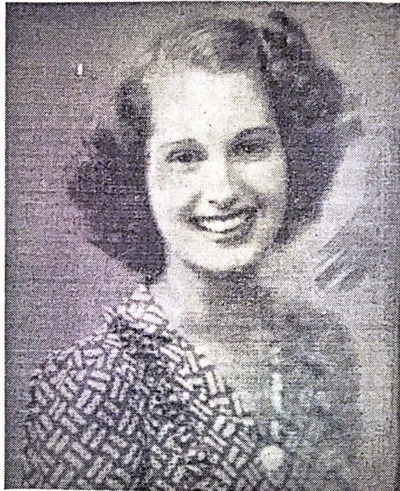
Su Majestad Lillian I. Reina de Primavera de la Universidad. El baile de su Coronación servirá para engrosar el Fondo Pro Ayuda Económica a estudios pobres del Consejo de Estudiantes.

el privilegio de tenerla entre sus vecinos. Su escuela superior la cursó en la Escuela Superior Central en donde formó parte del Club de Economía Doméstica. Como a nuestra reina le encantan los niños cuando llegó a la Universidad se decidió por Normal y, actualmente cursa su segundo año con esperanza de seguir en Edu-