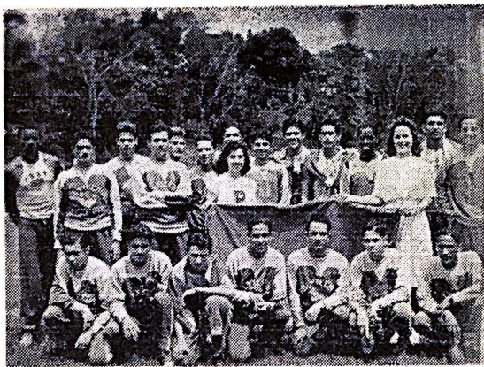
El equipo del Politécnico en compañía de sus dos bellas madrinhas posa para el fotógrafo de LA TORRE.