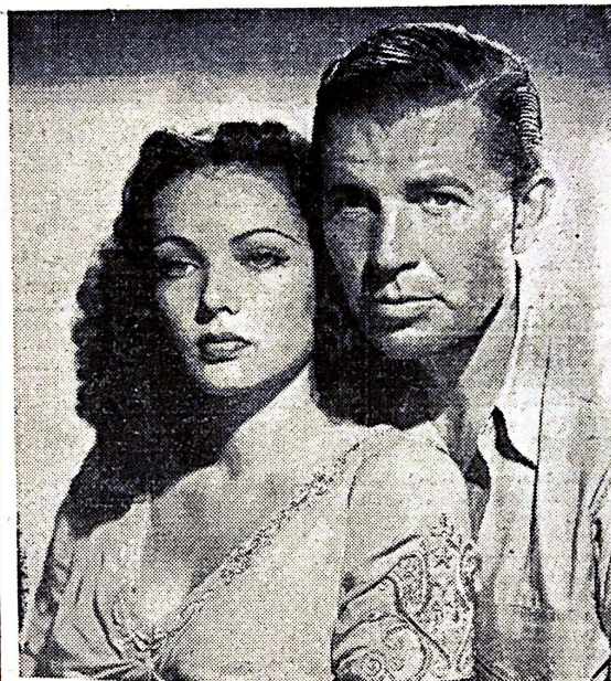
Gene Tierney and Bruce Cabot

Minimum cases and medium cases with lesions less than 4 cm are, as a rule, "out-patients" who report periodically to Health Centers for observation and treatment. Those who need free treatment may apply to their nearest Public Health