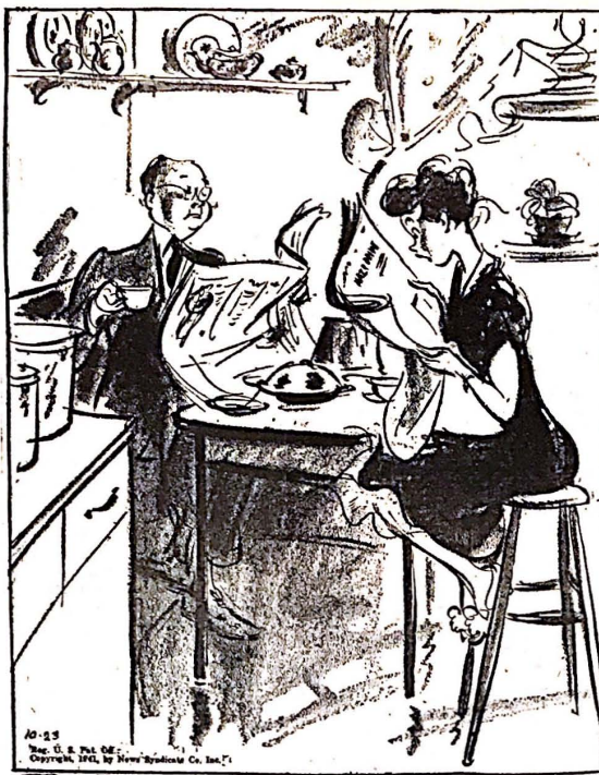
—Si Inglaterra está haciendó lo que tú decías que debía hacer!

"Al campo Don Nuño voy, (A la columna opuesta)