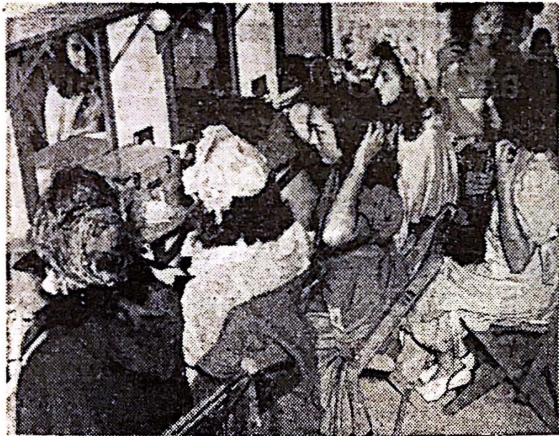
Como si fueran verdaderas estrellas, las "extras" no economizan esfuerzo en darse un maquillaje convincente.