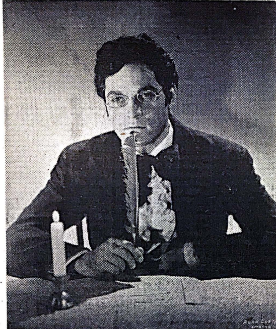
Alan Curtis, el notable actor aparece aquí en su caracterización de Franz Schubert para la gran obra cinematográfica "Serenata de Amor". En esta película, que será exhibida como Actividad Social para los estudiantes, acompaña a Curtis la actriz Iona Massey, quien según la crítica se apunta en este "film" el triunfo más grande de toda su carrera. Desde el lunes hasta el miércoles próximos se exhibirá la obra en el Teatro Paramount.

Quienes no hayan satisfecho el plazo correspondiente el primero de noviembre serán suspendidos de clase hasta tanto lo hagan.