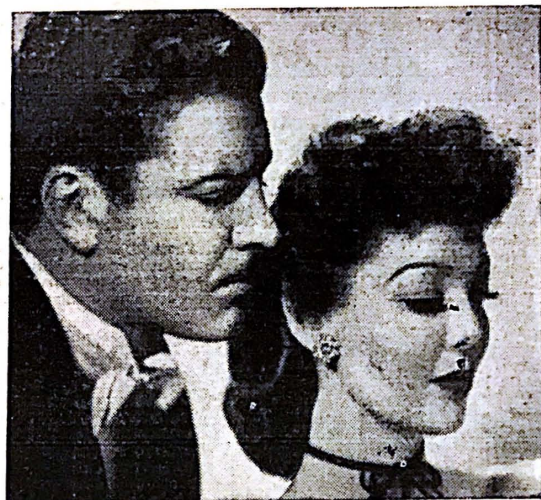
Loretta Young and Robert Preston