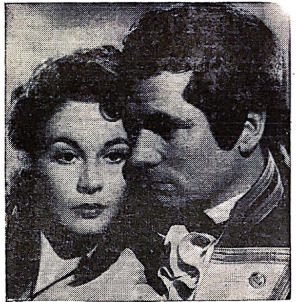
Vivien Leigh and Laurence Olivier

Committees will be organized at once, and work started in connection with a study for betterment of conditions. Recommendations and plans will be submitted to the Child's Congress in December. An exposition will be held to give information to the public to solicit