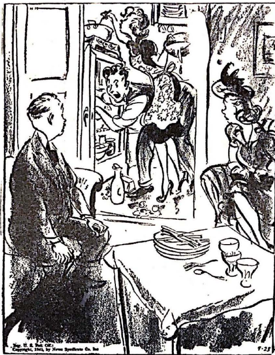
—Sí, sí quédense a comer... No es ninguna molestia.

The conditions of this war have naturally produced their own crop of jokes. There was the greengrocer whose shop was bombed, but who laid in a new stock next morning and carried on under the notice: "More open than usual." There was the prisoner of war who wrote home: "We are very well treated and very comfortable here. Tell it to the Army, tell it to the Air Force, tell it to the Marines." Here again, the humour depends not merely on adventitious wit, trusting to the fact that the German censor was unlikely to catch the colloquial significance of "tell it to the Marines", but on good-tempered acceptance of a grim but unavoidable fact. The same thing appears in the popular advertisement showing a bomb-disposal party leaving their lorry, with its very "live" load, to turn in to a coffee-stall saying, "Just time for a hot Bovril." It is only fair to add that the stall-keeper does not appear to share their confidence (To the opposite column.)