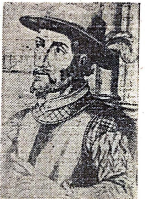
Don Juan Ponce de León Explorador y Colonizador Intrépido cerca del río, y conde a bordo a algunos de ellos, armados con sus arcos y flechas, y luego lo acompañe a tierra y entré en una canoa con ellos, en toda paz. "Deseando Juan Ponce saber si había otro puerto más seguro que el del Aguada, pedí veinte soldados (Pasa a la página 8)

"La armada fué al puerto del Aguada que está en la dicha isla de San Juan, fronterero de la boca del río Guorabo. Por orden del caudillo bajé a tierra solo en una barca, y hablé en su lengua a los indios que estaban en unos llanos