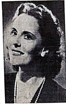
Jarmila Novotna: debuta esta noche en el Festival Operático