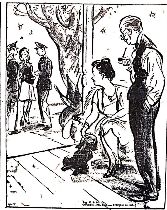
—La mayor parte de los soldados parecen muchachos. ¿No cree? Pero supongo que nosotros les parecemos viejos a ellos.

STRANGUDESKI TUZ OMSK OMSK (A la columna opuesta)