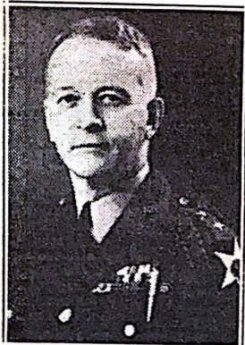
Comandante General Collins