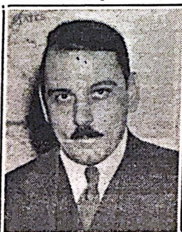
Luis Muñoz Marín

Facultad de Artes y Ciencias Los candidatos para los grados