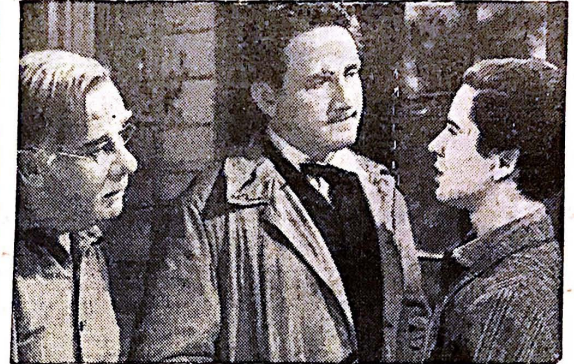
EDISON, LIFE PLAN

It was impossible for us to see much of the country. I made a hurried one-day trip in one direction to Anton and Penonomé, during the Easter vacation, and a second trip