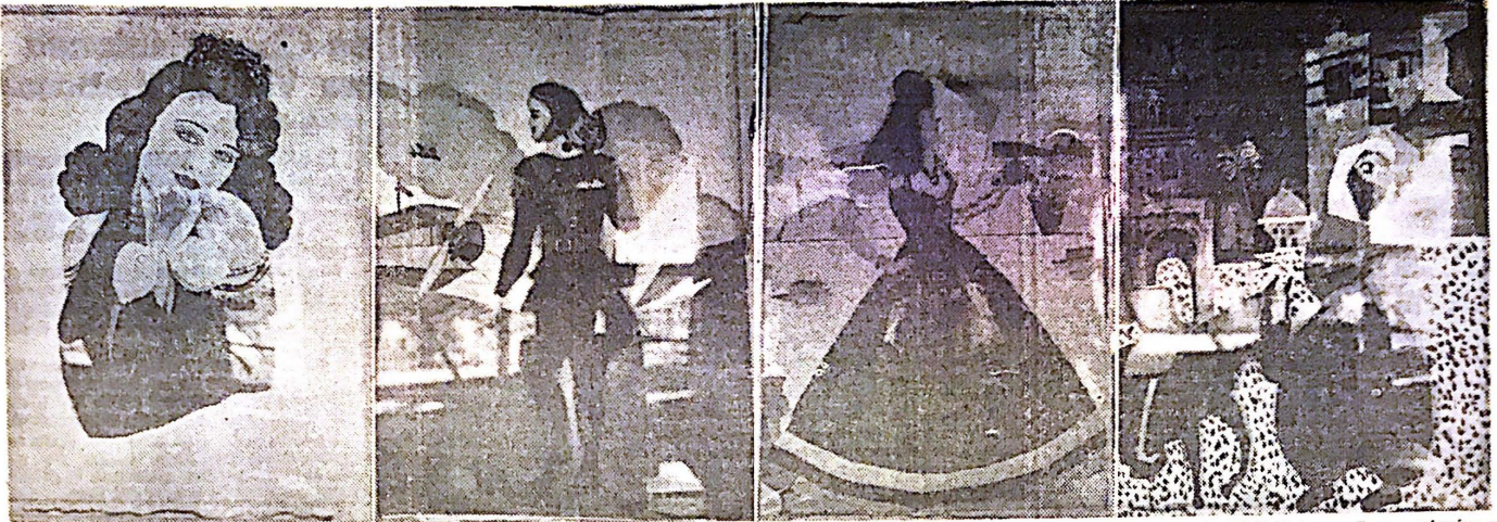
Estos preciosos maniqués son parte del trabajo realizado por las alumnas que toman la clase de diseño de modas con el catedrático de arte Walt Dehner. Los maniqués están terminados en los géneros mismos en que luego se harán los trajes diseñados.