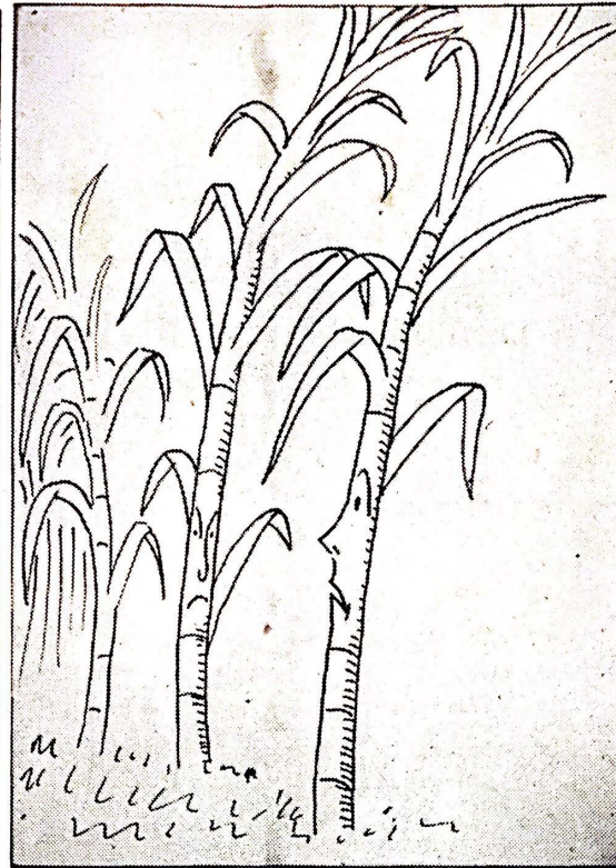
—Nada, chica, que son las nuevas leyes, lo mejor es ver de que modo nos hacemos palmas. Así daremos materia prima para las nuevas pavas.