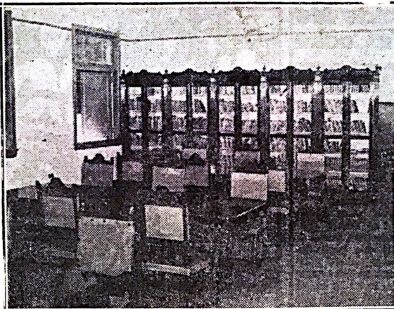
El Salón Puertorriqueño