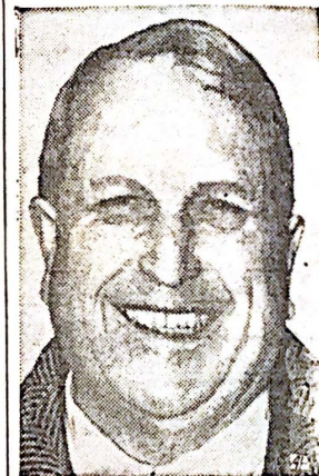
Hearst: Donó el trofeo

Hasta la fecha todo indica que los ataques aéreos no son suficientes para demoralizar y derrotar a un pueblo que tenga espíritu de pelea y fe en sus ideales. Madrid, malamente defendido, resistió durante la embestida de los aviones italogermanos Londres, erizado de defensas antiáreas y de nidos de