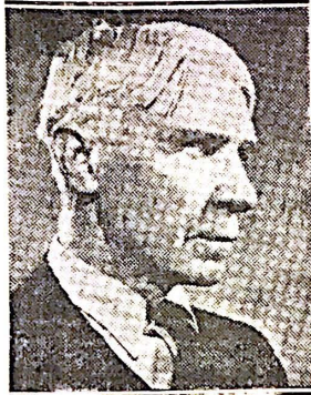
Sandburg: espera venir

La Presidencia Honoraria de la Conferencia ha sido ofrecida al Gobierno (Pasa a la página 8)