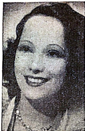
"Over the Moon" Tells a Tale of Romance.

Spice, color, a trick-a-minute for your diversion when you want to stop thinking, and just sit back in your seat to be entertained after a jaded day, await you at the Paramount in Santurce. Merle Oberon is presented in "Over the Moon".