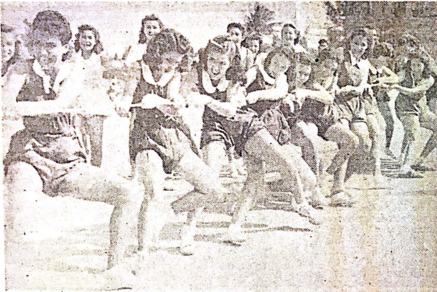
La guerra en la Universidad, afortunadamente, se limita a la de estas muchachas que intentan arrasar con sus adversarias, que no aparecen en la foto. El grupo pertenece a las clases de Educación Física para señoritas. Tal parece que el fotógrafo se asustó un poco al enfrentarse con estos rostros fieros.