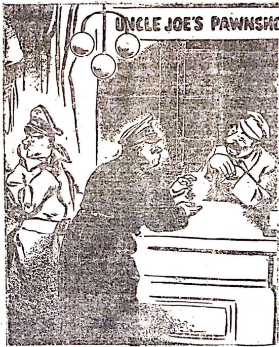
—¿Por cuánto me empeña esta crucifixa?