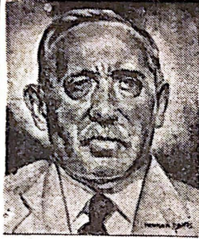
Don Santiago Iglesias

ferencia sobre el "Libro Puertorriqueño" para dictarla en la Universidad en el próximo mes de enero.